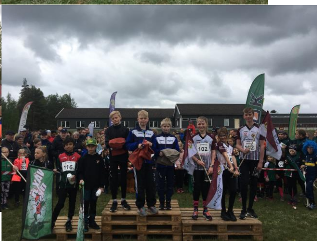
Nässjö OK på prisfallen i klass C till vänster och även i klass B till höger